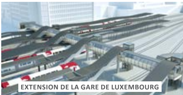
EXTENSION DE LA GARE DE LUXEMBOURG