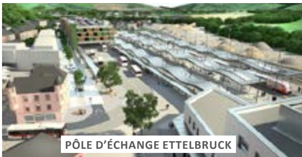
PÔLE D'ÉCHANGE ETTELBRUCK