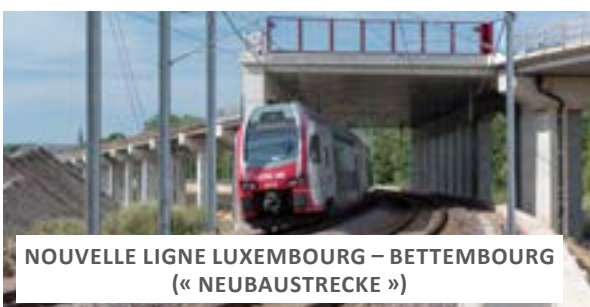
NOUVELLE LIGNE LUXEMBOURG – BETTEMBOURG (« NEUBAUSTRECKE »)