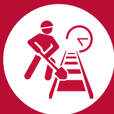
DIVERS TRAVAUX D'ENTRETIEN