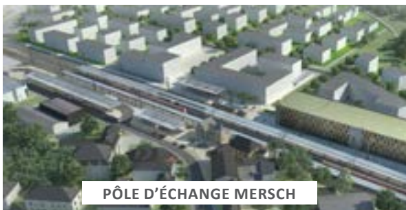
PÔLE D'ÉCHANGE MERSCH